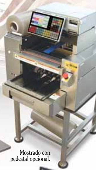
Mostrado con pedestal opcional.