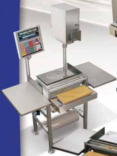
Pictured with optional wrap station components.